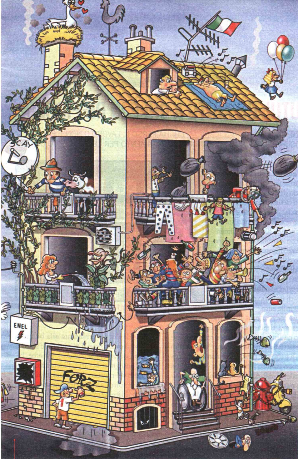
DOLCE CASA Ogni anno in Italia si scatenano un milione di liti condominiali. I motivi? Dai cattivi odori ai rumori molesti.